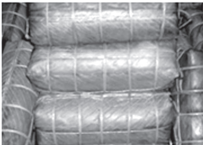
gói bánh như hình ảnh dưới đây:

Đây là quang cảnh gói bánh Tét, bánh Ít để cúng giỗ cho Ông Nội tôi, vào ngày 16-6 âm lịch ngày 5-8-2001