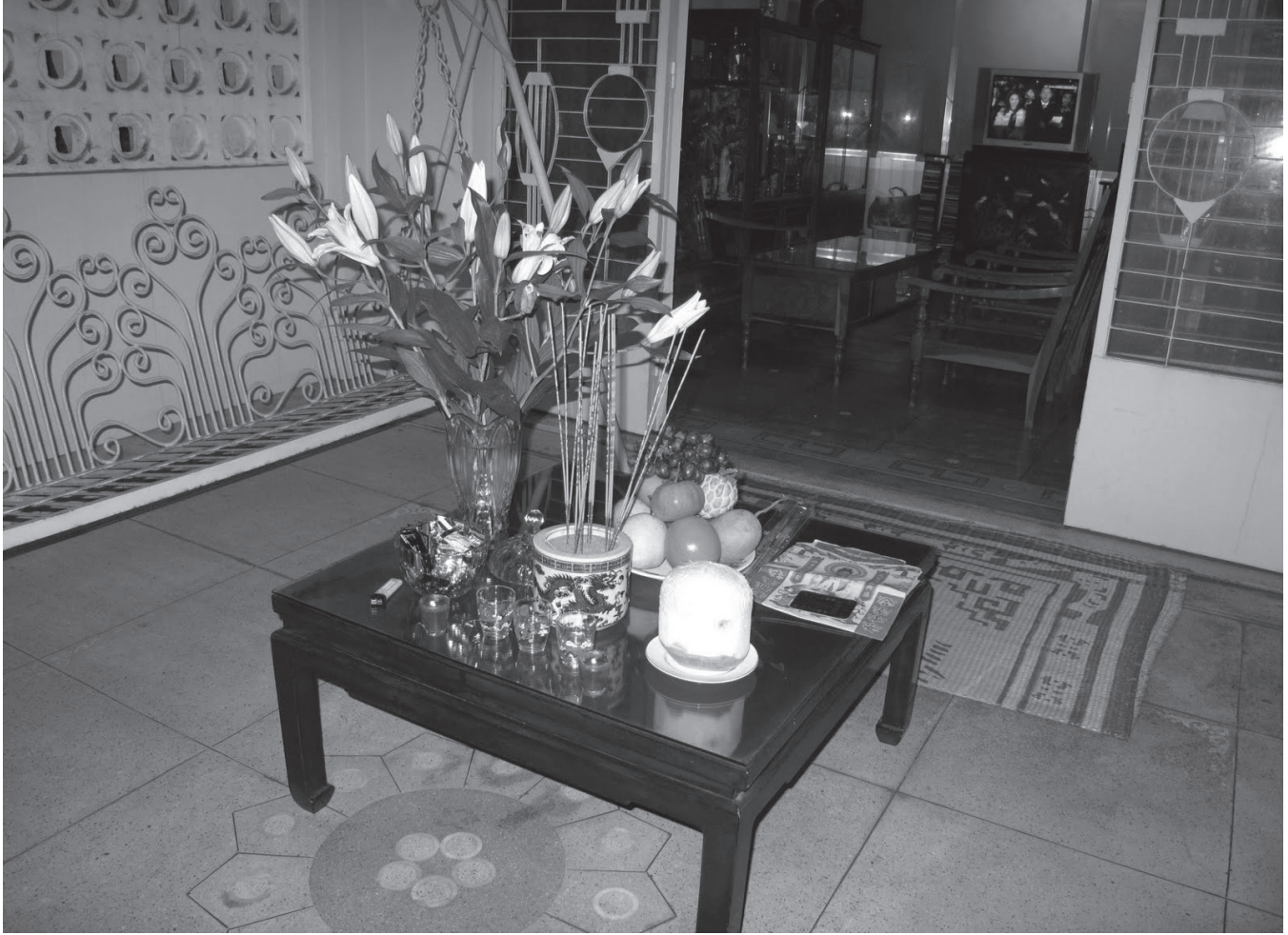
Bàn cúng giao thừa.

gặp năm mạng Mộc Trường hợp này, giống như người có: mạng Thổ gặp năm mạng Thủy-mạng Thủy gặp năm mạng Hỏa-mạng Hỏa gặp năm mạng Kim và mạng Kim gặp năm mạng Mộc.